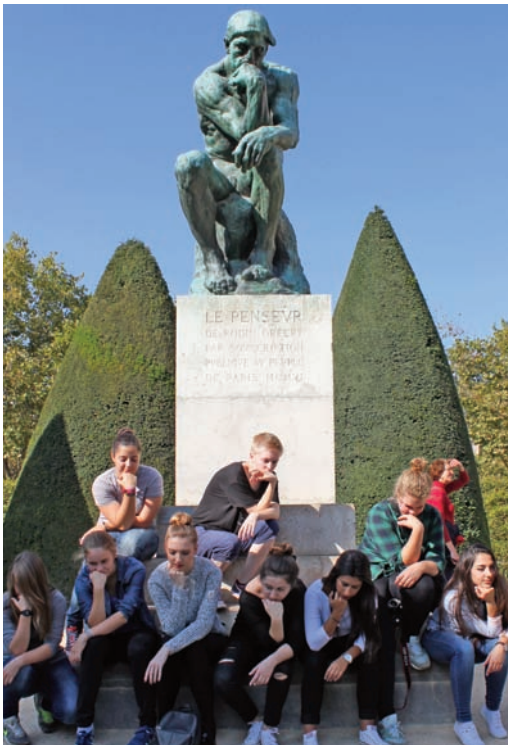
Fahrt des LK Kunst nach Paris: Besuch des Musée Rodin mit „Nachstellen“ der berühmten „Denker“statue

Mit Zuschüssen zu Klassen- und Kursfahrten sowie Schüleraustauschen wurden Extraaktivitäten wie Museums- und Theaterbesuche u.ä. ermöglicht.